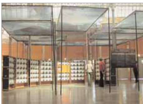
La communauté de hasard- La salle du monde - R.M. Installation-Lieu unique Nantes 2005/06

Le repas, le service de table et la galerie de portails d'une communauté de hasard de 150 personnes qu'il a conçu la même année pour la collection d'art contemporain dans le château d'Oiron /France - 1992/93 La salle du monde Oiron - inverse l'inter-dépendance traditionnelle entre le château et „ses“ villageois, eux qui, après en avoir longtemps assuré le service en sont désormais les hôtes privilégiés. Le développement du projet La salle du monde passe à la fois par un volet intitulé, la salle privée - dont une première actualisation a eu lieu en 1994 à Aix-la-