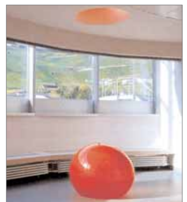
1992, corridor public - R.M. Art & Architecture - Hôpital Sierre

Chapelle (Neuer Aachener Kunstverein), à Stuttgart (Akademie Schloss Solitude) et à Berne (Kunsthalle) sous forme du projet de cinquante vases bicéphales en porcelaine bleue à l'effigie de couples individuels - et par la confrontation, à une échelle planétaire, de différents systèmes de référence liés au rituel du repas et au lieu. La mise en relation et l'échange entre les endroits et entre les différentes communautés de hasard fait partie de La salle du monde .